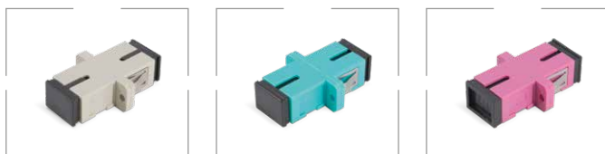
OM2 SC/UPC símplex OM3 SC/UPC símplex OM4 SC/UPC símplex